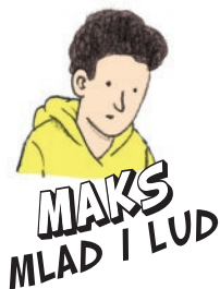
MAKS MLAD I LUD