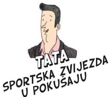
TATA SPORTSKA ZVIJEZDA U POKUŠAJU